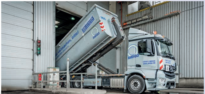
Die Anlieferung des Restabfalls: Bis zu 90.000 Tonnen landen hier pro Jahr.

In der jährlich anfallenden Trockenstabilatmenge steckt ein energetischer Anteil, der den Strombedarf von fast 20.000 Vierpersonenhaushalten deckt.