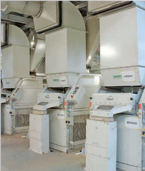
Mit diesen Geräten werden die einzelnen Abfallfraktionen maschinell getrennt.

Ein Blick ins Innere des Recyclingcenters verrät, wie das Ganze funktioniert. Als erstes wird der Abfall nach dem Zerkleinern in sogenannten Rotteboxen getrocknet. Diese haben ein Fassungsvermögen von rund 350 Tonnen, werden durch einen Kran von oben befüllt und danach mit einem Deckel verschlossen.