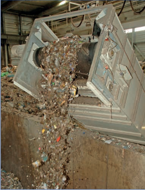
Vor der Lagerung in den Rotteboxen wird der Abfall zerkleinert.